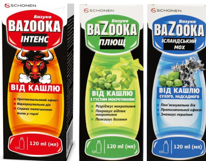
Зображення 4 Зображення 5 Зображення 6

лицьових сторін упаковок Дієтичних добавок: