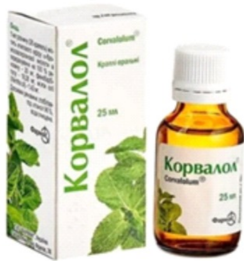
Оформлення упаковки лікарського засобу «КОРВАЛОЛ®»

У листопаді 2023 року Антимонопольним комітетом України прийнято рішення, яким постановлено визнати, що ТОВ «ДКП «ФАРМАЦЕВТИЧНА ФАБРИКА» вчинило порушення законодавства про захист від недобросовісної конкуренції, у вигляді неправомірного використання оформлення упаковки лікарського засобу «КОРВАЛАЗИД», схожого на оформлення упаковки лікарського засобу «КОРВАЛОЛ®», яке АТ «ФАРМАК» раніше почало використовувати в господарській діяльності, що може призвести до змішування з діяльністю АТ «ФАРМАК». На ТОВ «ДКП «ФАРМАЦЕВТИЧНА ФАБРИКА» накладено штраф у розмірі 485 387 грн.