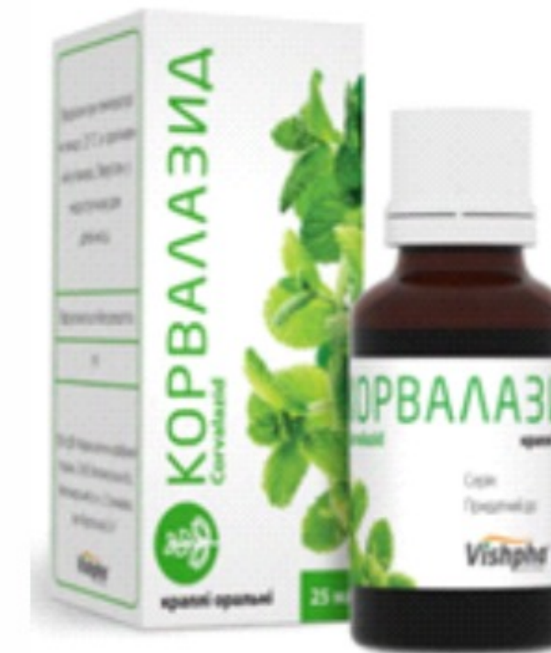
Оформлення упаковки лікарського засобу «КОРВАЛАЗИД»