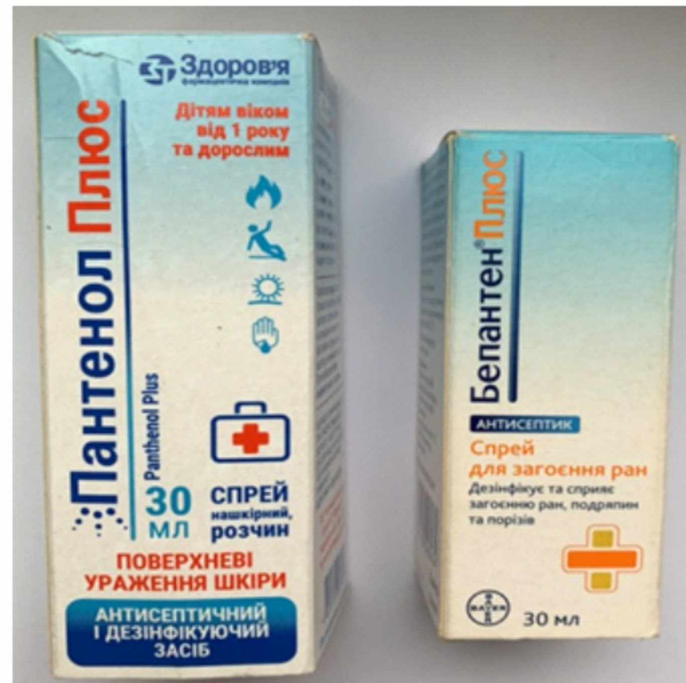
Оформлення упаковки Спрея «Бепантен® Плюс»