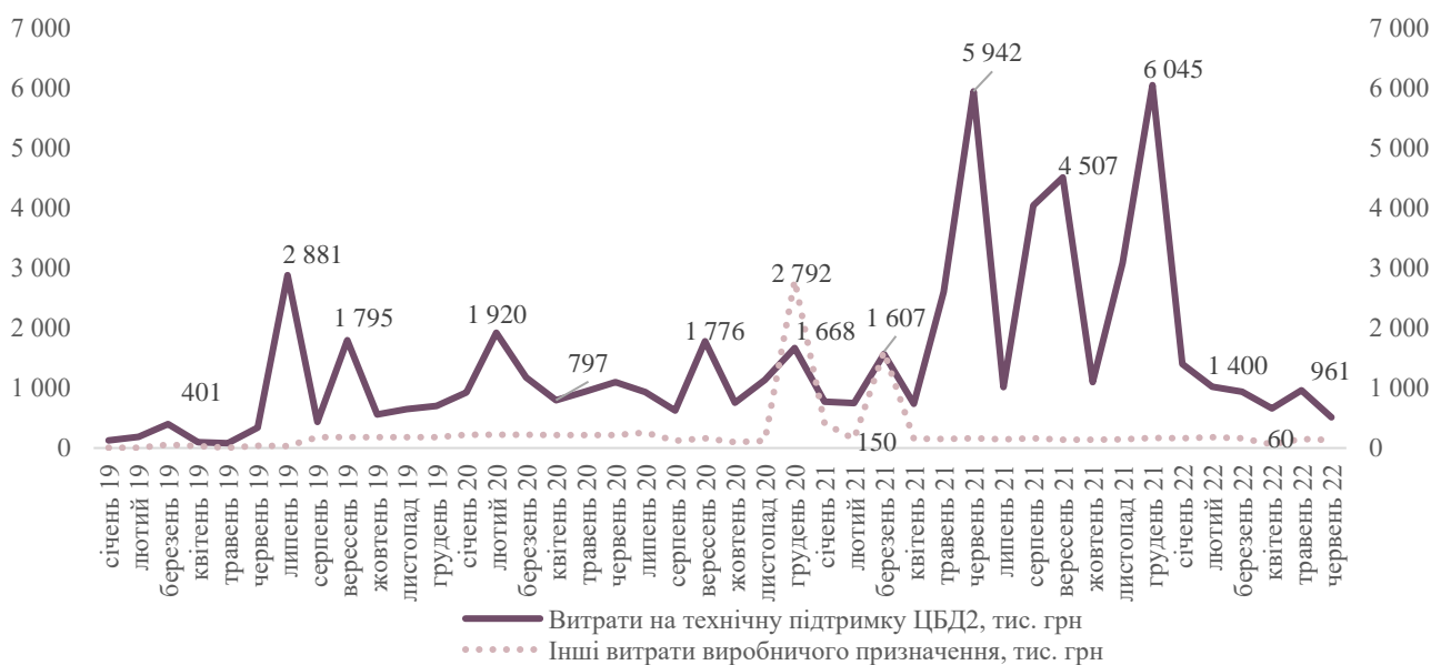
Графік 1. Динаміка витрат на технічну підтримку ЦБД2 та інших витрат виробничого призначення протягом 2019 – червня 2022 років (тис. грн)