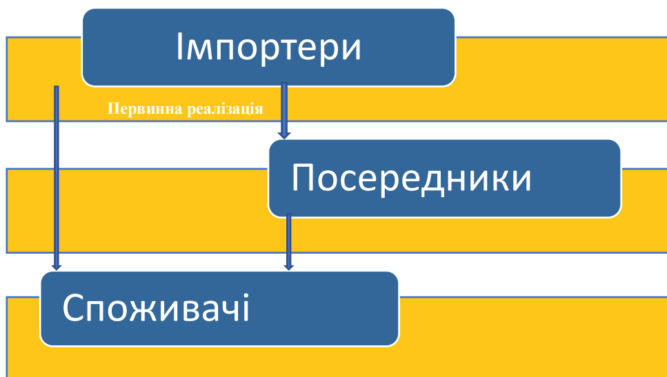
Рис. 1. Схема обороту Товару на внутрішньому ринку України