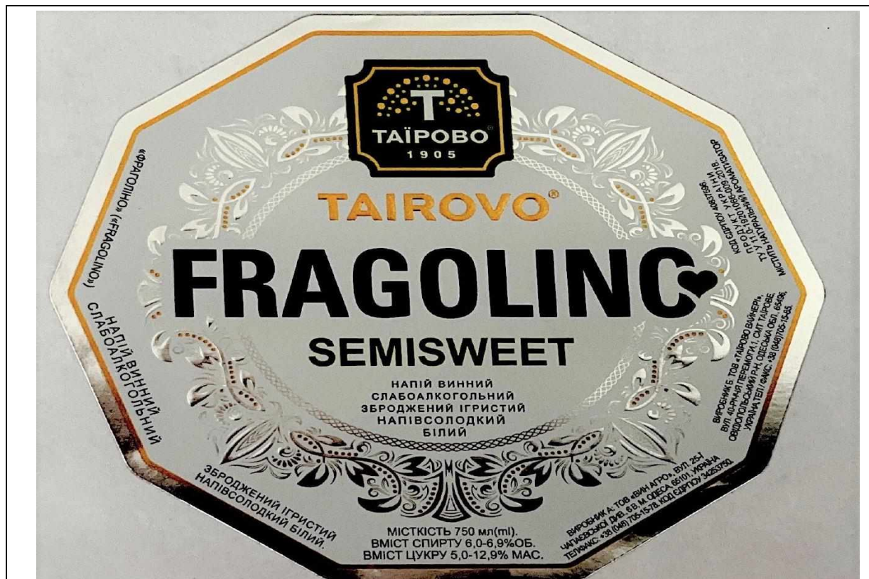
Зазначено від продукції: «Напій винний слабоалкогольний зброджений ігристий напівсолодкий»