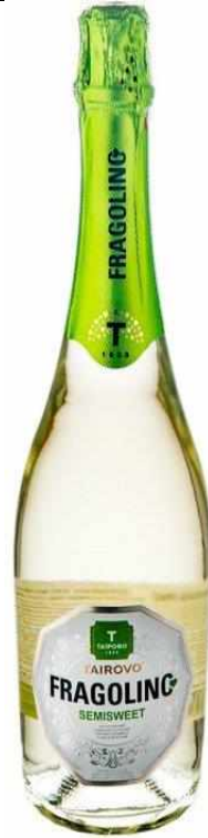
Загальний вигляд пляшки Напою