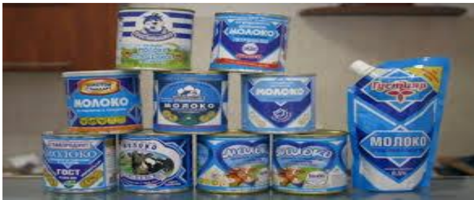
Російська Федерація та Республіка Білорусь