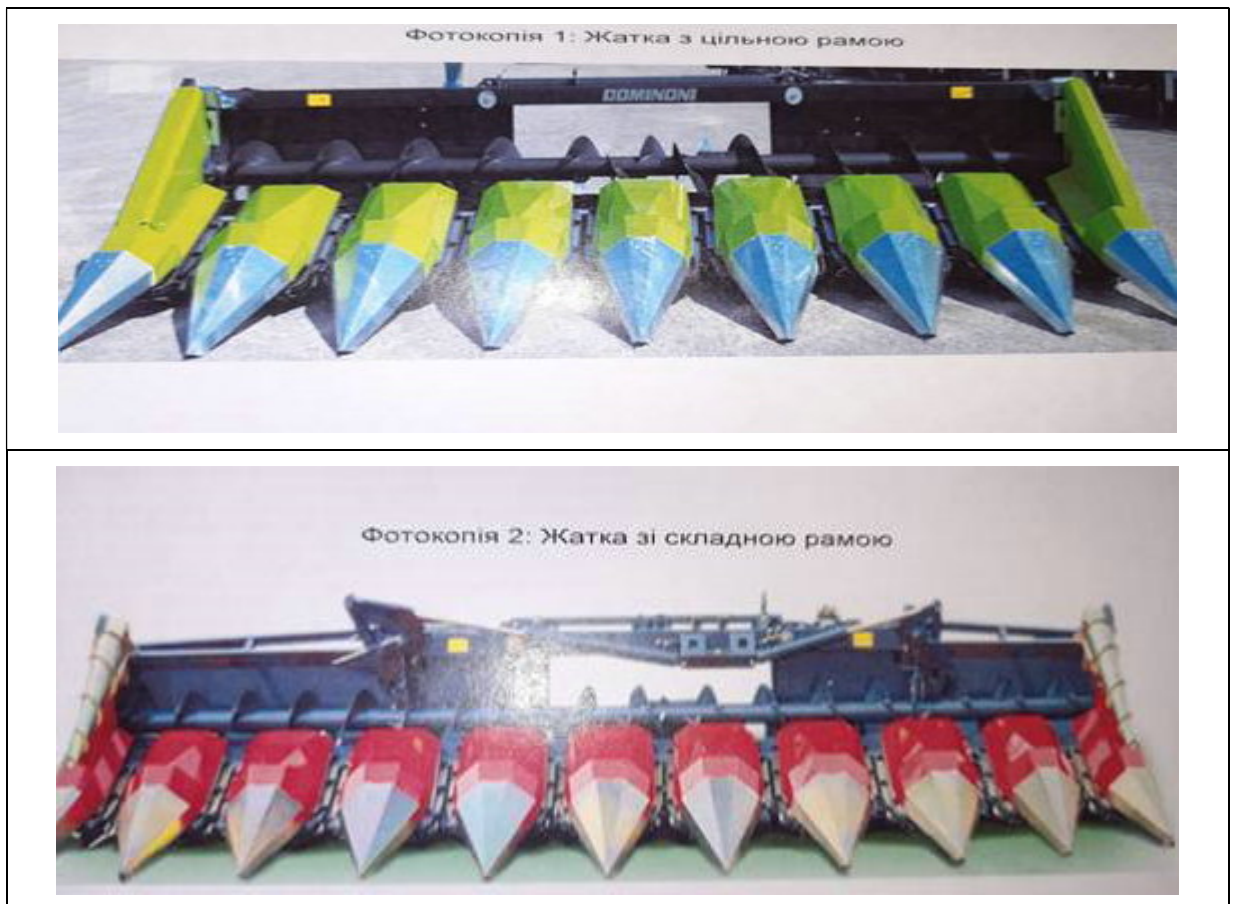
Фотокопії 1 та 2