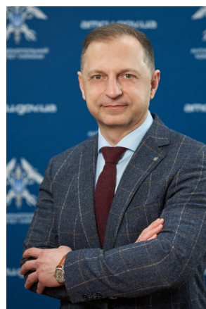
Сергій ШЕРШУН Державний уповноважений