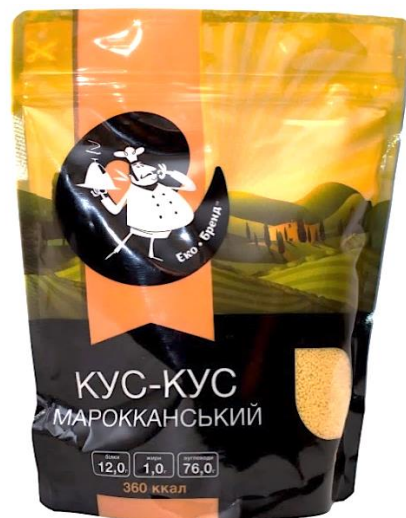
Зображення 2. Упаковка продукту «КУС-КУС МАРОККАНСЬКИЙ»