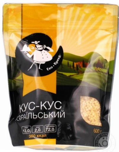
Зображення 1. Упаковка продукту «КУС-КУС ІЗРАЇЛЬСЬКИЙ (ПТІТИМ)»